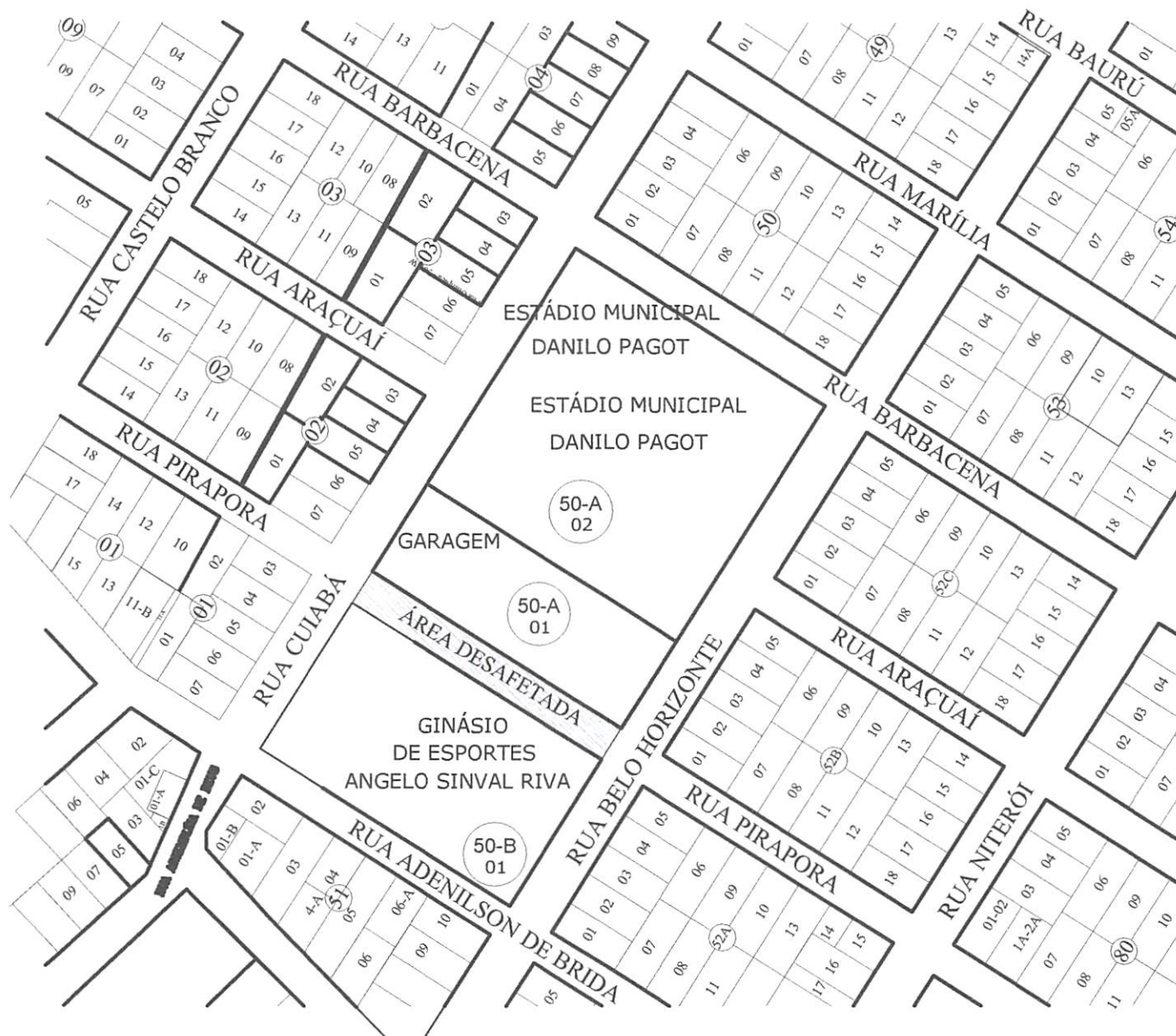
CROQUI MOSTRANDO A ÁREA A SER DESAFETADA Esc: SEM ESCALA